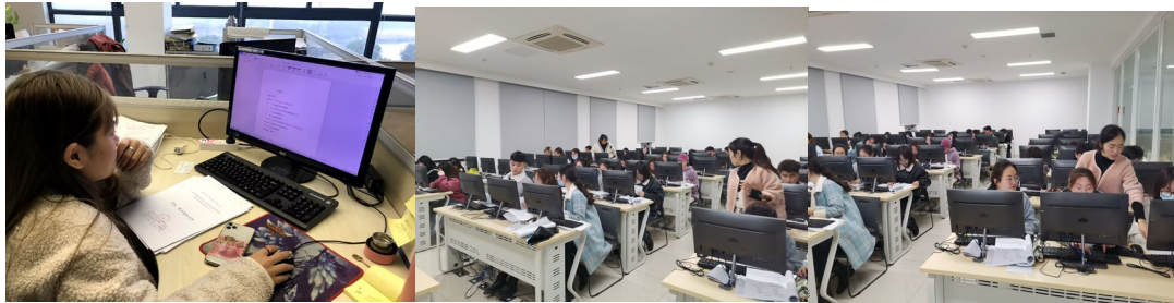
图4 公司技术骨干参与专业实践指导

苏州鼎鑫企业管理有限公司不断发挥企业在现代职业教育中的重要作用，积极参与我系财税大数据应用职业教育人才培养的全过程，配合我系教学要求，投入大量的资金和精力开展专业和课程建设，提供资深专家和行业能手直接参与教学和技能指导和培训，建议财税大数据应用专业的税费计算与申报课程，相比于大数据与会计和大数据与审计更有特色，课程名称改为：智能化税费计算与申报，并增加学时。苏州鼎鑫企业管理有限公司不断探索现代会计职业教育教学改革，成效显著，为校企进一步深度合作打下坚实的基础。