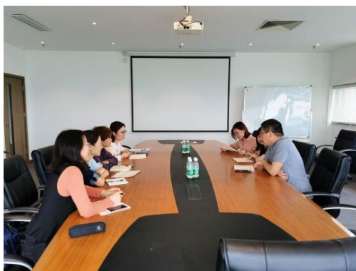
图1 鼎鑫企业管理有限公司参与苏信学院专业人才培养方案修订研讨

级财税大数据应用人才培养方案中税费计算与申报的课程名称和课时设置都提出了修改建议；从满足业财税一体化岗位工作的需求角度，建议增设业财税融合大数据应用实训课程。