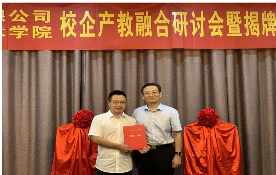
图 13 校企专家参与产教融合研讨