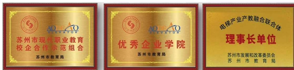
图 7 市级成果