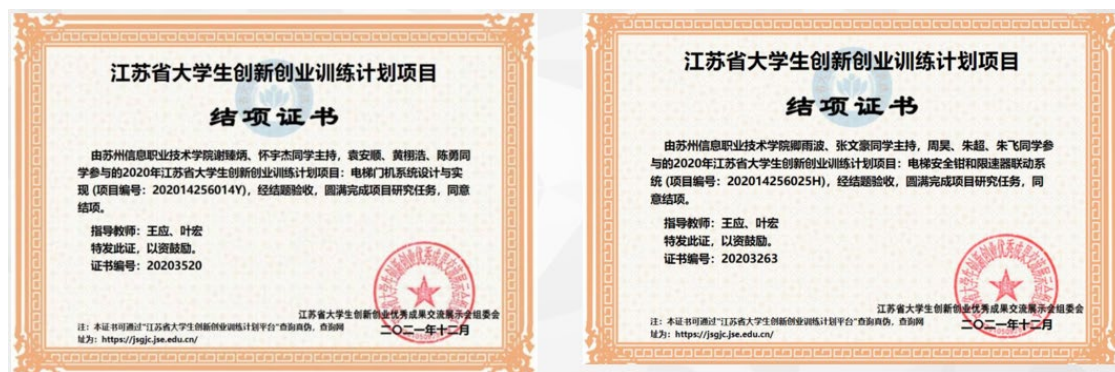
图 8 大学生创新创业成果