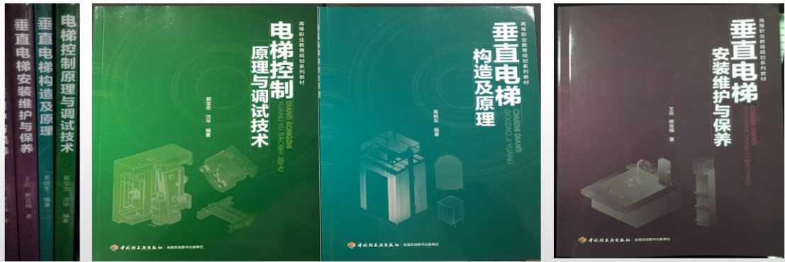
图 12 合编教材

目前德奥电梯的技术骨干与苏州信息职业技术学院的教师共同开发编著了三本电梯专业系列教材，并由中国轻工业出版社正式出版。企业深入参与到学校的教学改革中，目前学校的电梯工程技术专业建设委员会有三名委员是德奥电梯资深的技术专家，每年定期举行专业建设研讨会。同时企业有五位技术骨干到学校做电梯专业的兼职教师，与学校老师建立一对一的协作关系，共同完成课程开发，目前校企合作开发课程《垂直电梯构造及原理》《电梯控制原理与调试技术》《垂直电梯安装维护与保养》《电梯工程项目管理与安全技术》通过学校认定。未来将继续挖掘企业技术专家和教师的潜力，继续编写专业教材和开发多样化的课程资源等。