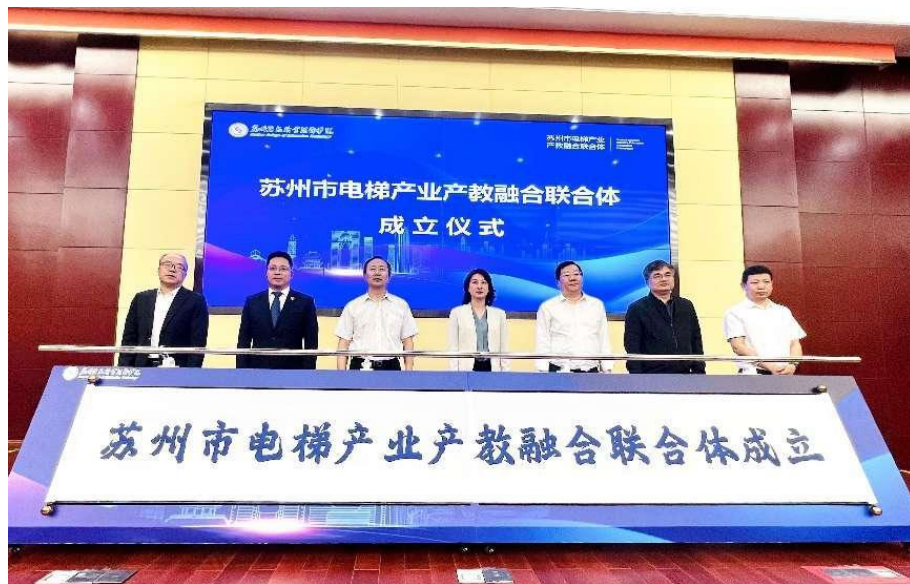
图 14 苏州电梯产业产教融合联合体成立

2023年5月，苏州市成立了产教融合联合体，联合了区域内20多家电梯整机、零部件及兄弟院校等，苏信学院是牵头单位，德奥电梯是理事单位，校企双方将在现有校企合作成果的基础上，总结和分享目前校企合作、产教融合的经验，与苏信学院一起继续积极探索和实践产教融合，让更多的电梯企业、院校参与进来，打造一个“利益共同体”，未来计划与苏信学院共同打造一个依托苏州信息职业技术学院为平台、企业为主体的多院校多企业参与的电梯产业融合体，为学生提供更多专业对口的实习和工作岗位，为企业输送更加专业的对口人才，实现企业、学校、学生的互利共赢。