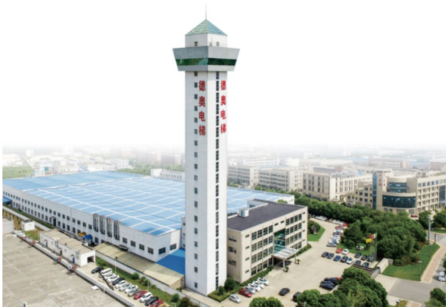
图 1 德奥电梯公司全景

为积极响应国家人才发展战略和《国务院办公厅关于深化产教融合的若干意见》（国办发〔2017〕95 号）、《省政府办公厅关于深化产教融合的实施意见》（苏政办发〔2018〕48 号），为进一步推动和深化产教融合、校企合作、充分发挥企业在技术技能人才培养和人力资源开发中的重要主体作用，强化产教融合型企业的带动引领示范作用，公司积极申报并成功入选江苏省第三批产教融合型试点企业建设培育名录。