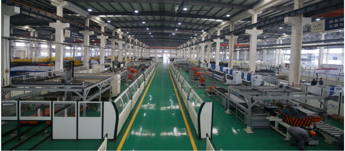
图2 德奥电梯公司车间