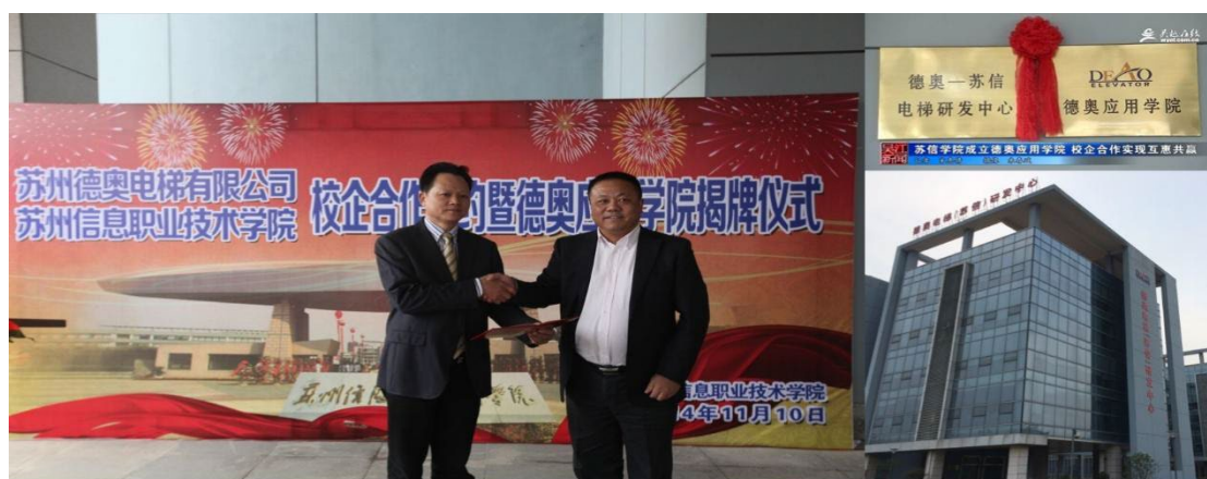
图3 德奥应用学院成立

年苏州信息职业技术学院与苏州德奥电梯签订了校企合作协议，达成共同建设依托苏州信息职业技术学院的“德奥应用学院”和“德奥电梯（苏信）研发中心”，2015年试点现代学徒制，以订单班形式开设电梯应用方向“德奥订单班”；同年获批电梯工程技术专业并开始招生。校企双方共同制定人才培养方案、共同设计开发课程、共建实训室等。采用联合申报招生（电梯3+3专业）、联合人才培养模式，目前累计培养了218名电梯工程技术专业毕业生，其中德奥电梯累计接收了约50名优秀毕业生和顶岗实习生，德奥电梯设立德奥奖学金每年奖励电梯专业优秀毕业生，累计向学校捐赠各类电梯教学实训设备价值100多万元。