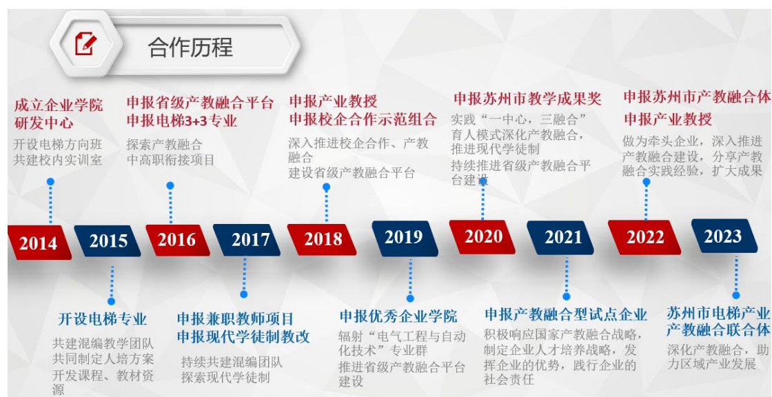
图4 校企合作发展历程