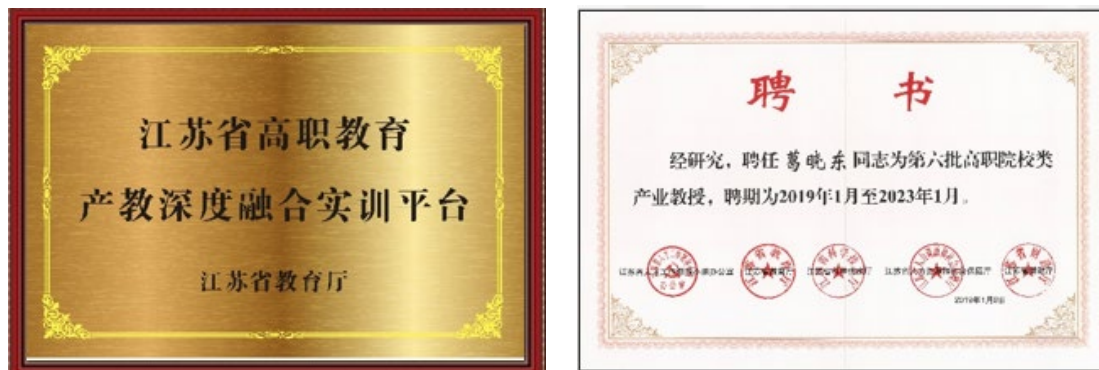
图 6 省级成果