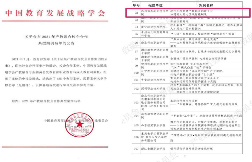
图 5 教育部 2021 年产教融合校企合作典型案例